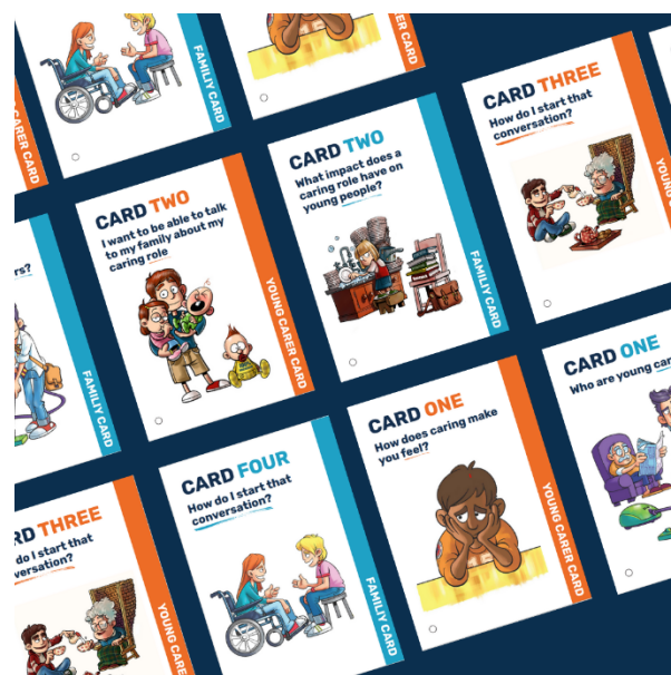
‘Φροντίζοντας στην οικογένεια, ξεκινώντας από την οικογένεια: ξεκινώντας τη συζήτηση μαζί (together). Κάρτες συζήτησης Cards

Οι νέοι φροντιστές και τα μέλη της οικογένειας μπορούν να τα χρησιμοποιήσουν μεμονωμένα για να προβληματιστούν σχετικά με βασικά ερωτήματα ή να τα